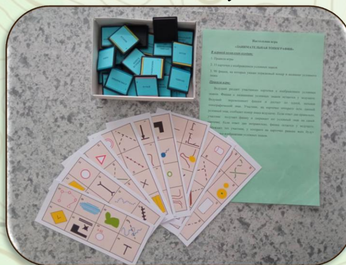
Фото №3. Комплект игры - лото «Занимательная топография»