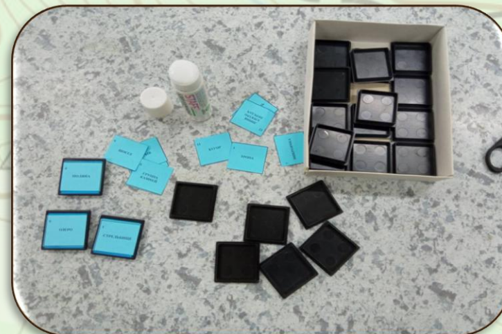
Фото №2. Фишки с указанием порядкового номера и названия условного знака