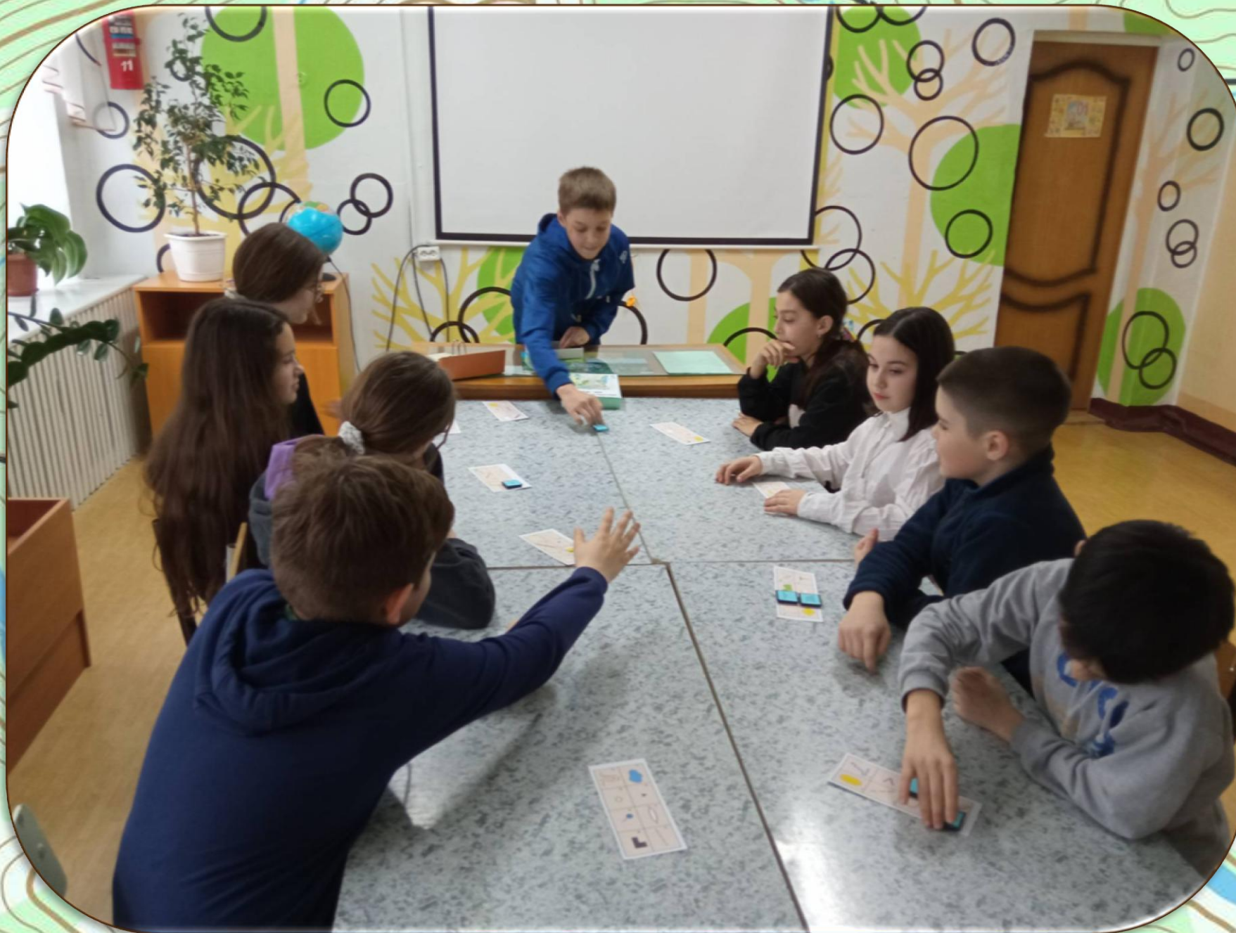
Фото №4 Обучающиеся объединения «Туризм» в процессе игры в лото «Занимательная топография»